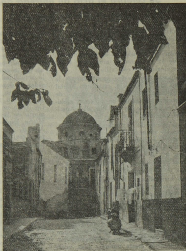
La cúpula de la Iglesia, desde la calle «dels Figueretes».

De todos modos, la foto nos evoca bien claramente un